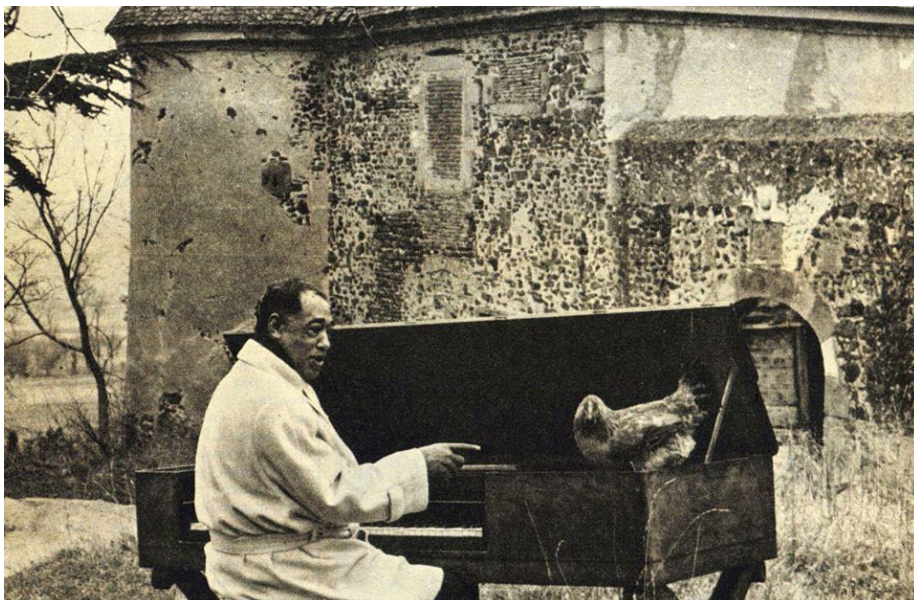
Duke Ellington à Goutelas (1966)

Depuis cet épisode extraordinaire, le château et le jazz sont restés liés ! Goutelas a rejoint en 2020 JAZZ(s)RA , plateforme des acteur·ice·s du jazz en région Auvergne-Rhône-Alpes . Des visites thématiques retracent cette histoire, la programmation musicale d'aujourd'hui fait la part belle au jazz dans toute sa diversité, et, à travers ses programmes de résidence, Goutelas affirme sa volonté de soutenir les artistes, l'émergence et la création.