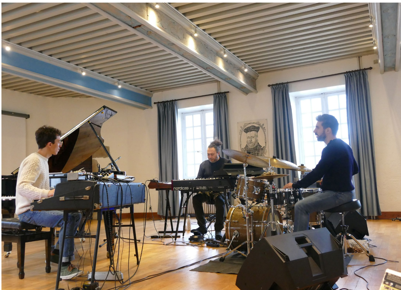
Résidence Sunscape, 2022

Au sein d'une équipe d'une quinzaine de personnes, l'équipe culturelle se compose de 5 salarié-e-s et est soutenue par des bénévoles tout au long de l'année. Parmi les salarié-e-s, deux personnes sont plus particulièrement attachées au suivi et à l'accompagnement de la résidence (chargée des résidences et chargée des projets musicaux).